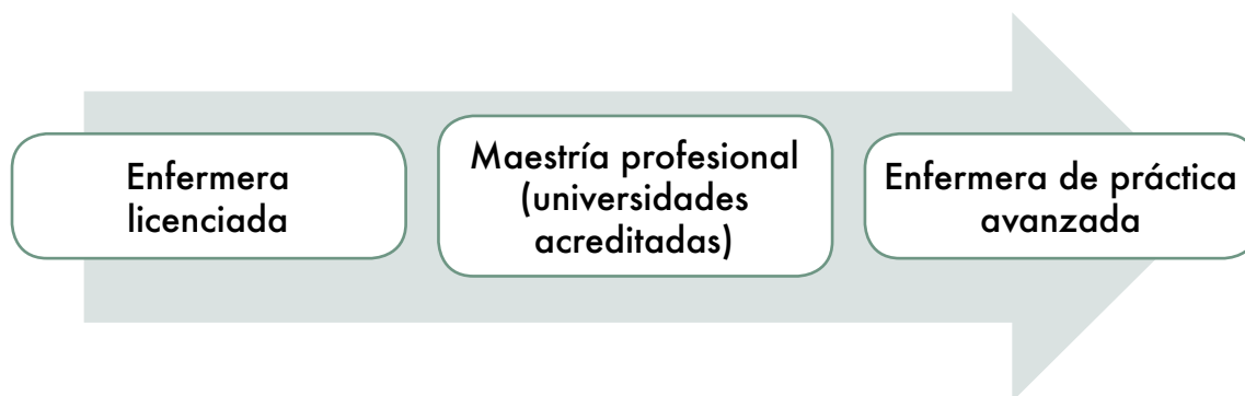
Figura 1. Modelo 1. Plan de formación para las enfermeras licenciadas

En el segundo plan, que corresponde al Modelo 2, las enfermeras licenciadas con experiencia profesional en las unidades de APS, se formarían a través de programas específicos y complementarios de enfermería de práctica avanzada ofrecidos por las universidades acreditadas. Los programas complementarios estarían integrados en un curriculum de actualización teórica y clínica, de conformidad con las competencias centrales de la enfermera de práctica avanzada (figura 2).