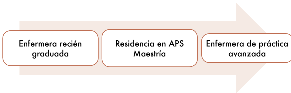
Figura 3. Modelo 3. Plan de formación en la EPA para las enfermeras recién graduadas

Los roles de la EPA también están determinados por las regulaciones y legislaciones nacionales. La regulación del profesional tiene el propósito de proteger a la población de prácticas inseguras; de asegurar la calidad de los servicios; de promover la formación continua, y de ofrecer a los usuarios y a la población las mejores competencias profesionales. Por lo tanto, para lograr los cambios necesarios en la implementación de la EPA, es fundamental que se ajusten las políticas y las regulaciones de la enfermería en vigor en los distintos países.